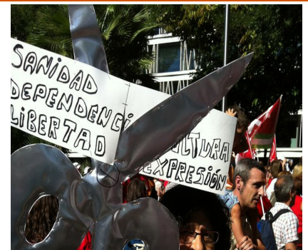
IMAGEN DEL MES

Sólo cerca de 24.000 cuidadoras no profesionales que se beneficiaban de la ayuda de la Ley de Dependencia de las cerca de 160.000 que constaban como tal han decidido seguir adelante con el estatus de cuidadora no profesional y pagar sus cotizaciones, con el consecuente impacto en la Seguridad Social y en menor medida, en el paro registrado. El impacto se nota ya en los datos de la Seguridad Social del mes de noviembre (de 205.678 afiliados menos, 85.233 eran cuidadoras no profesionales) y seguirá percibiéndose en los de diciembre.