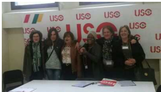
Foto de grupo de las mujeres que forman la Ejecutiva