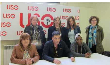
La recién elegida Ejecutiva en la rueda de prensa posterior al Congreso