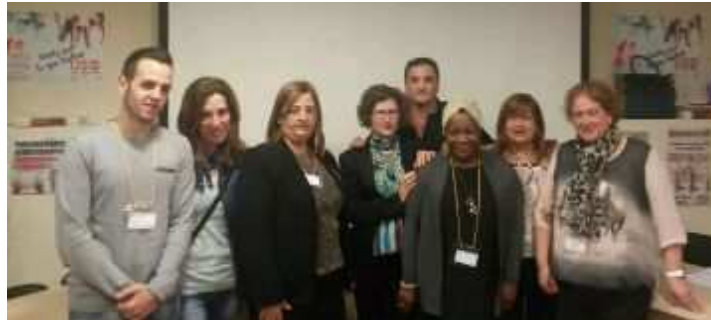
Miembros de la Ejecutiva de la Federación de Servicios