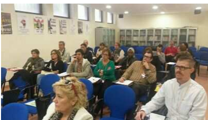
Asistentes al Congreso