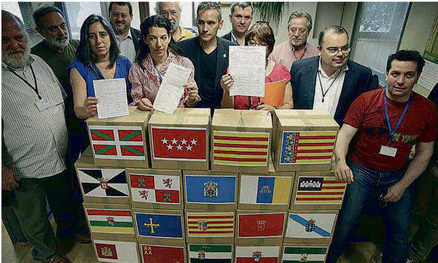
Primera de las cuatro entregas, realizadas ante la Defensoría del Pueblo, de firmas recogidas en las diecisiete comunidades autónomas.

* La MERP hemos elegido la RECOGIDA DE FIRMAS como campaña porque nuestro objetivo es impulsar un amplio movimiento QUE UNA A TODO EL PAÍS, por encima de cualquier diferencia, y hemos elegido entregarlas a las DEFENSORÍAS DEL PUEBLO porque es quien según la Ley debe amparar a la ciudadanía ante leyes injustas o cuya aplicación provoque injusticias.