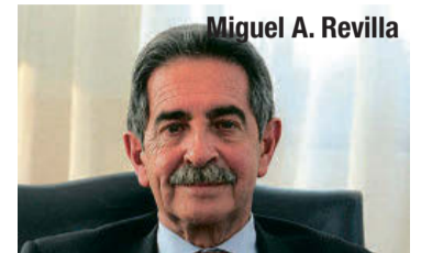
Miguel A. Revilla