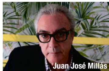
Juan José Millás