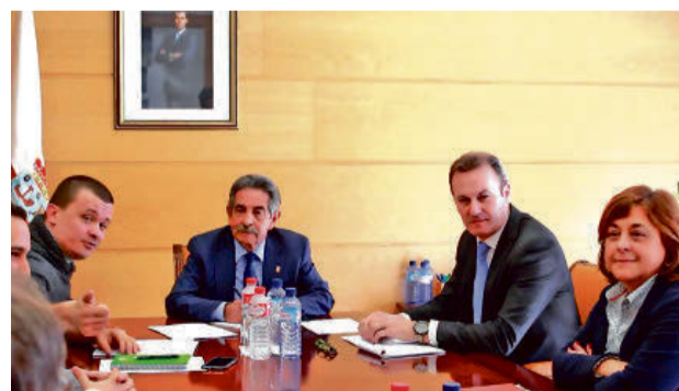
Miembros de la portavocía de la MERP con el presidente de Cantabria Miguel Ángel Revilla recibiendo su apoyo

En febrero de 2017, el Parlamento de Navarra aprobó una declaración institucional apoyando la propuesta para Blindar las Pensiones en la Constitución de la MERP